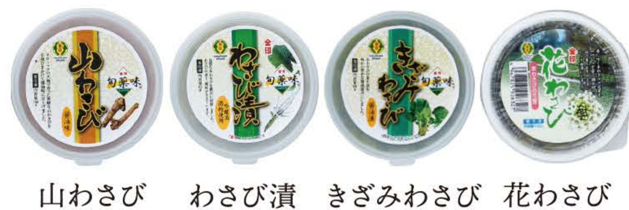
山わさび わさび漬 きざみわさび 花わさび